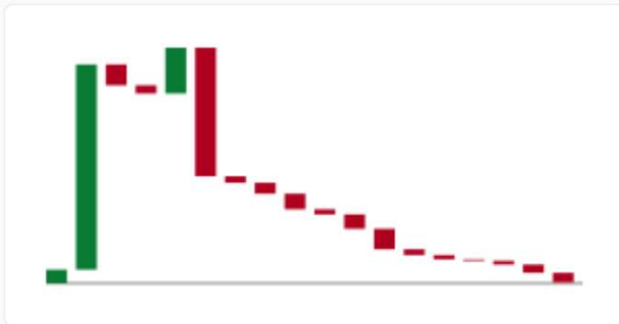
Fluxo Diário em Cascata